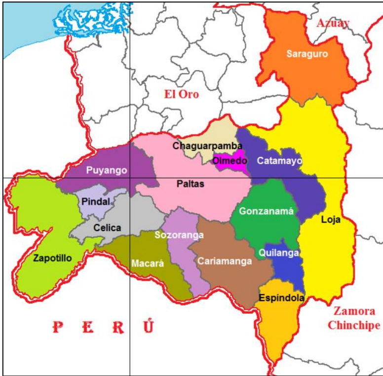
Gráfico 1: Cantón Loja en la provincia de Loja